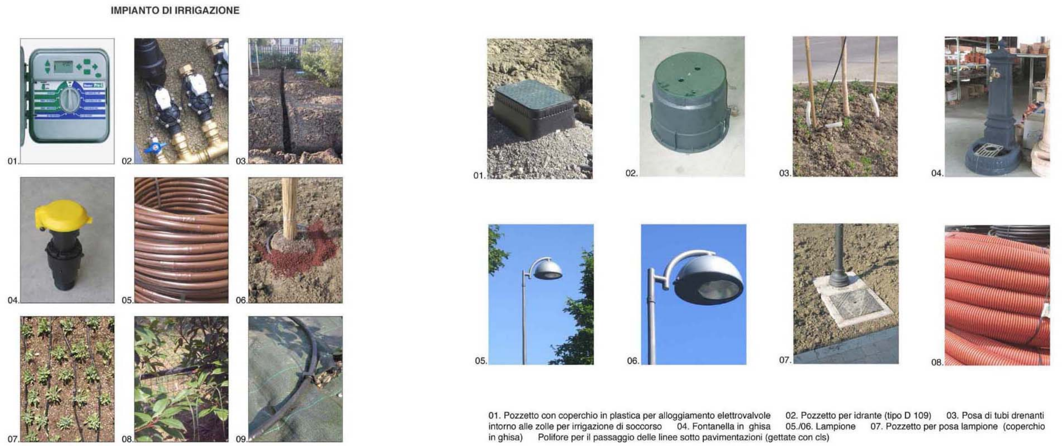
01. Centralina di programmazione digitale a tre programmi in grado di comandare più settori; 02. Gruppo elettrovalvole con filtro e rubinetto di fine linea; 03. Scavi idraulici; 04. Innesto a presa rapida "Piasson"; 05. Ala gocciolante autocompensante; 06. Predisposizione di anello gocciolante intorno alla zolla di un albero (nel parco è prevista per gli esemplari collocati all'interno di macchie arbustive); 07. Ala gocciolante predisposta in aiuole con arbusti ornamentali; 08. Ala gocciolante sospesa per l'irrigazione di siepi perimetrali; 09. Posa e fissaggio del tubo gocciolante su telo pacciamante anti-alga. Il telo è previsto all'interno delle aiuole con cespugli