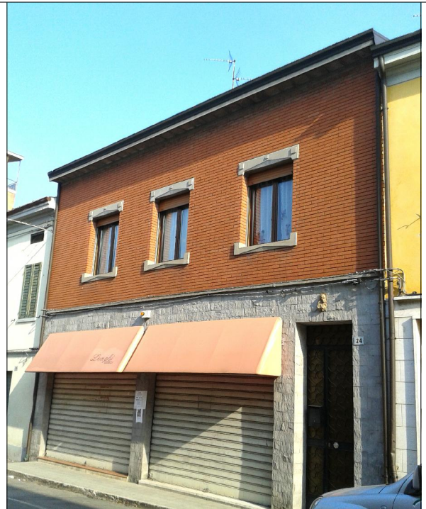
Prospetto su via Mazzini n. 24 - 26 - 28