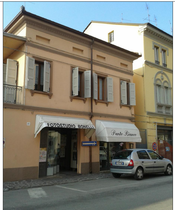
Prospetto su via Mazzini n. 37 - 39 - 41