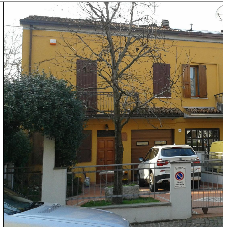
Prospetto su via Mazzini n. 79