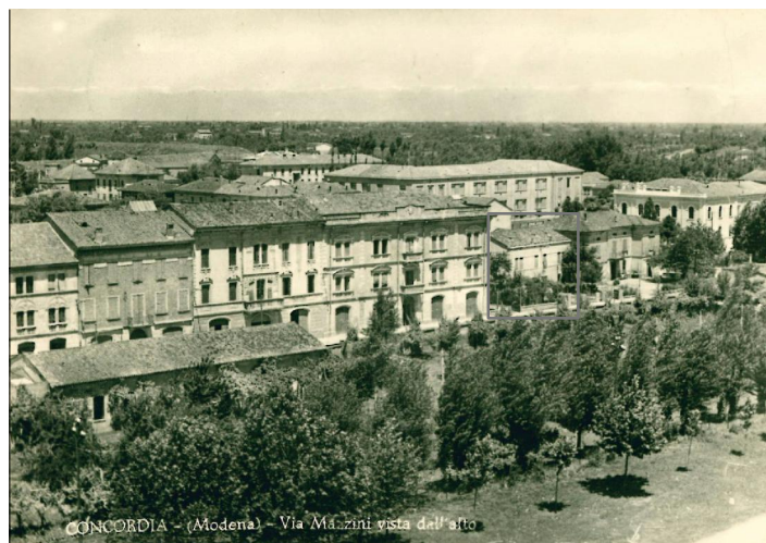
CONCORDIA - (Modena) - Via Mazzini vista dall'alto