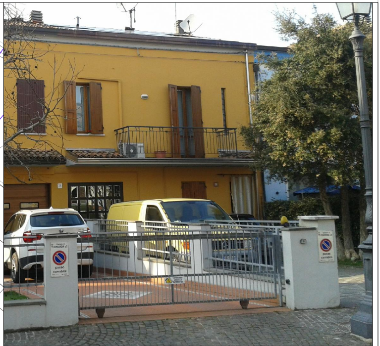
Prospetto su via Mazzini n. 83