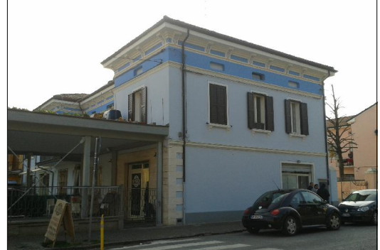
Prospetti su via Mazzini n. 85 - 87 - 89 e viale Dante Alighieri n. 22A