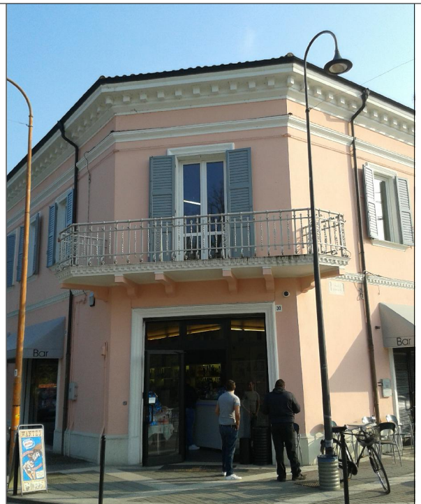
Prospetti su via Dante n. 30 e viale Garibaldi n. 24 - 26 - 28