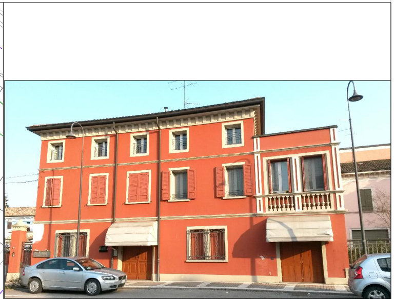
Prospetto su viale Garibaldi n. 18 - 20 - 22