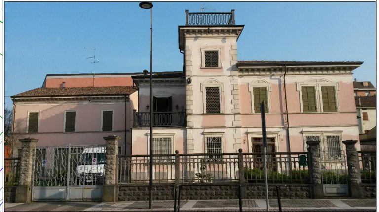
Prospetto su viale Garibaldi n. 16