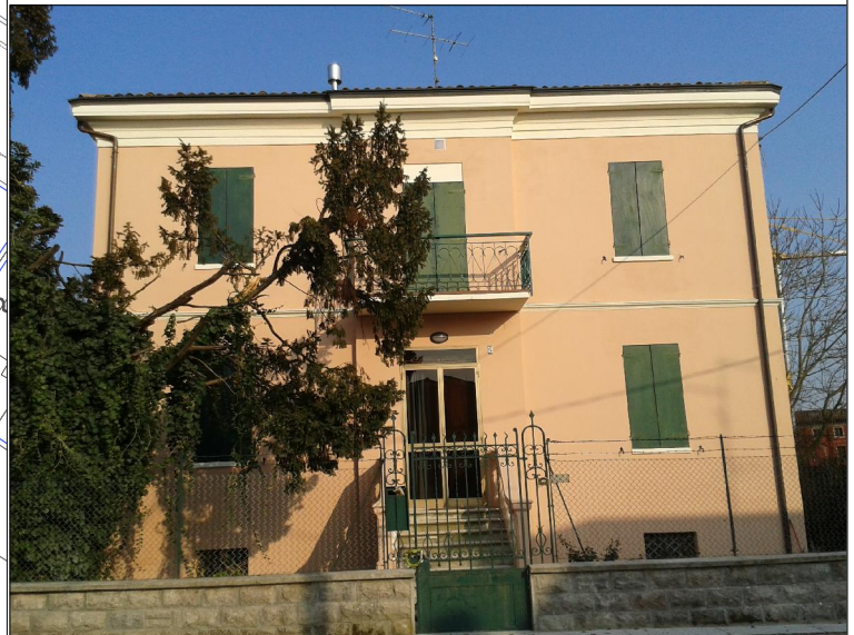
Prospetto su via Decime n. 6