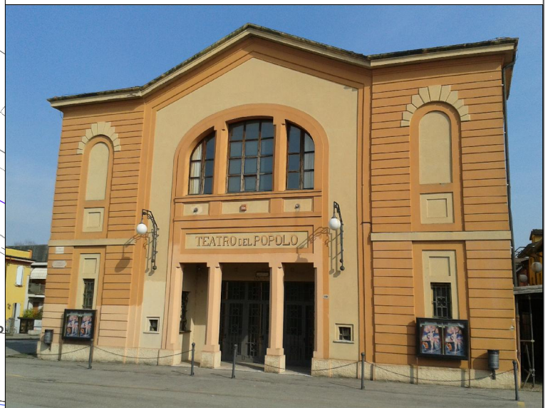
Prospetto su via della Pace n. 108 - piazza delle Arti