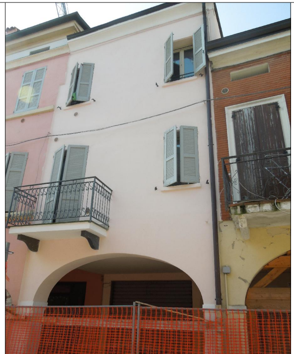
Prospetto su via della Pace n.75-77