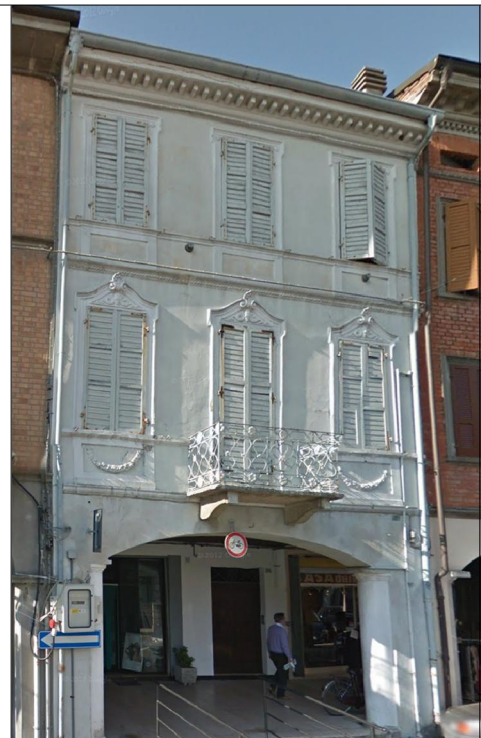
Prospetto su via della Pace n.57-59