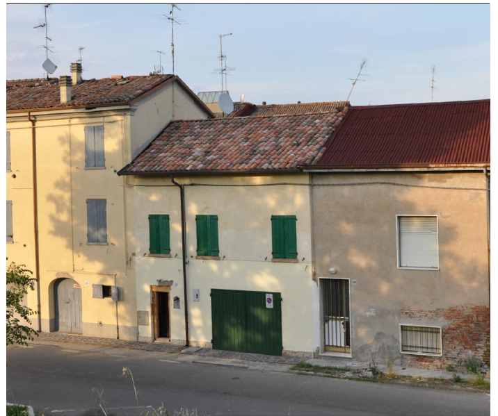
Prospetto su via Don Minzoni n.21