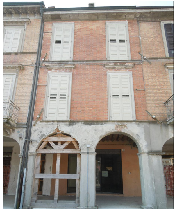
Prospetto su via della Pace n.49