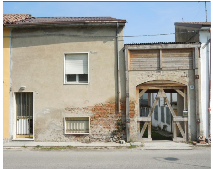
Prospetto su via Don Minzoni n.20-20/a