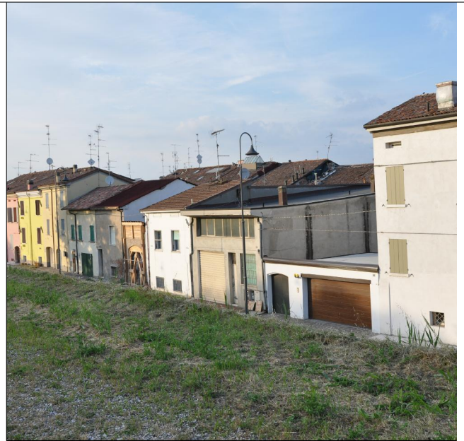
Prospetto su via Don Minzoni n.16/a