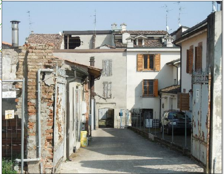
Prospetto su via Don Minzoni