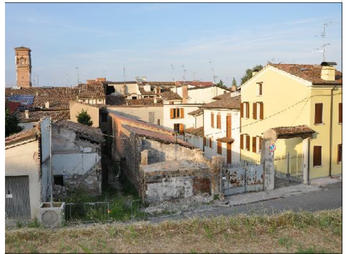
Prospetto su via Don Minzoni