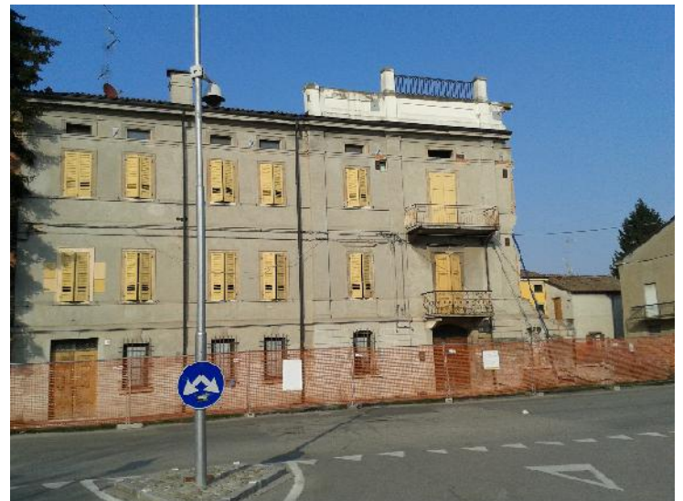
Prospetto su via Dante Alighieri n. 1-2-4