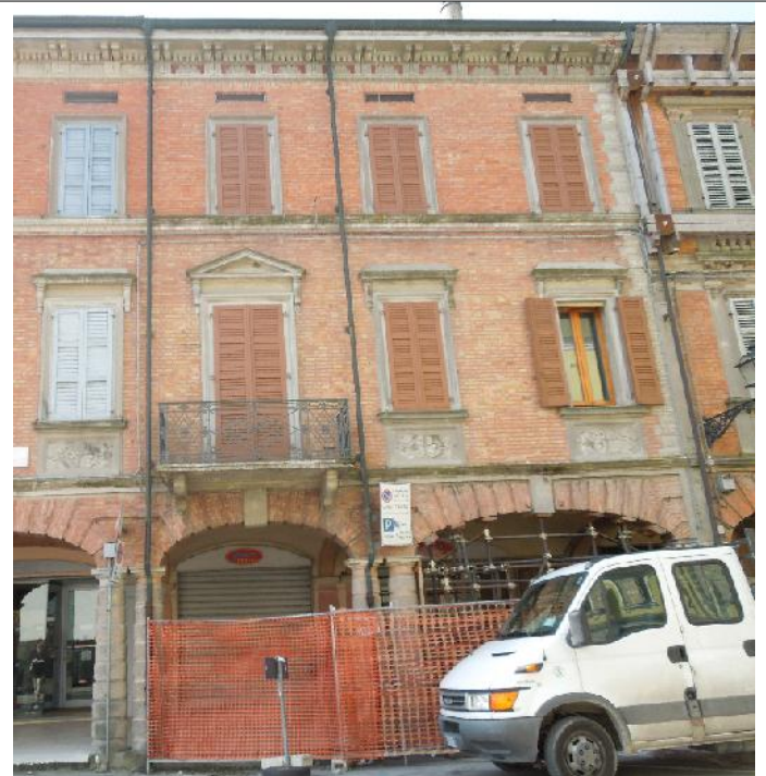
Prospetto su via della Pace