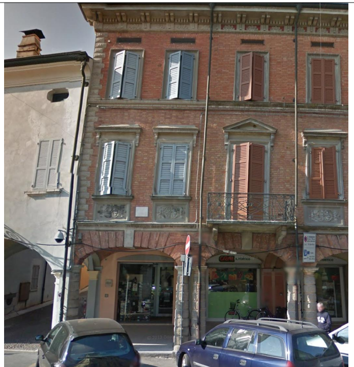
Prospetto su via della Pace n.1