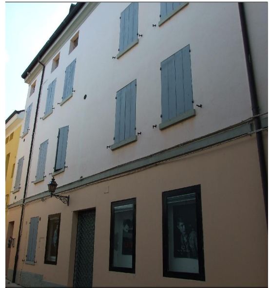
Prospetto su via Negrelli