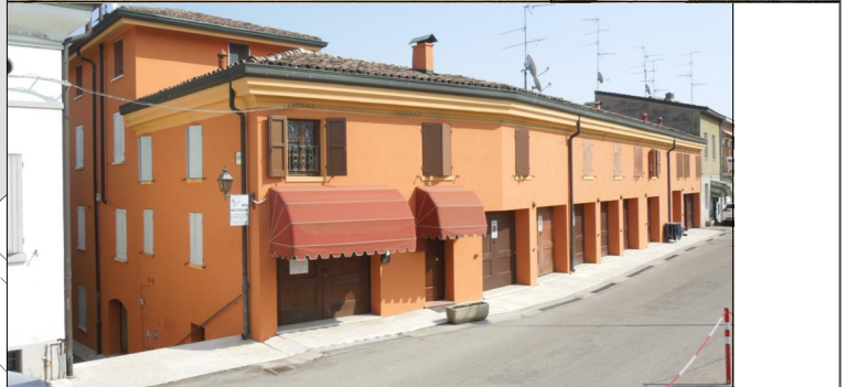
Prospetti su via Don Minzoni n. 5 - 6 e via Nigrelli