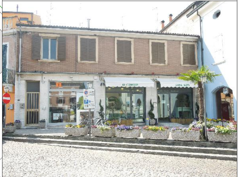
Prospetto su piazza della Repubblica n. 28 - 28/1 - 28/2 - 28/3