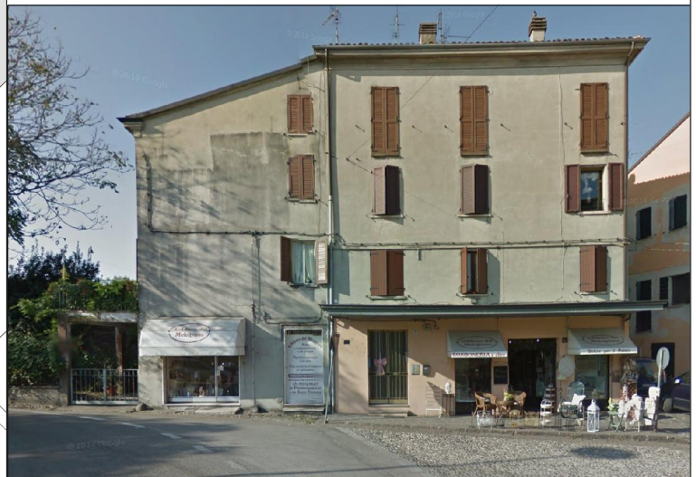
Prospetto su piazza della Repubblica n. 18 - 20 - 22 - 24