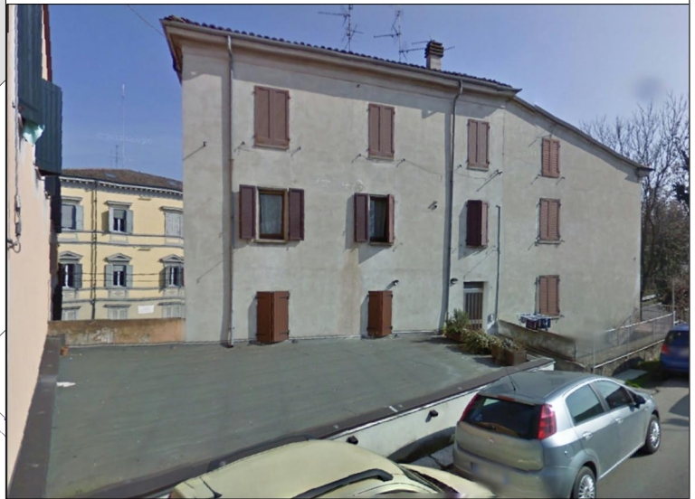
Prospetto su via Don Minzoni n. 1