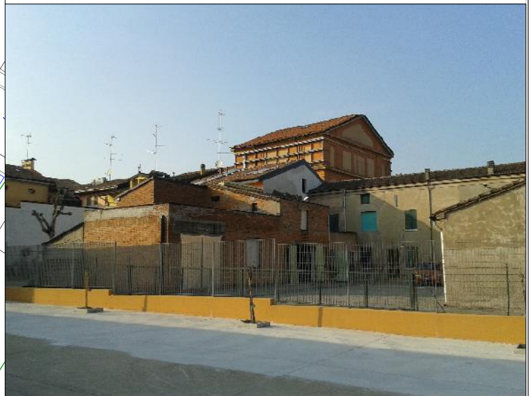
Prospetto su via Decime