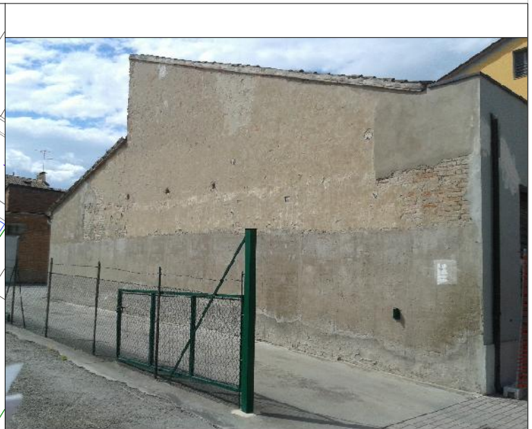
Prospetto su via Decime