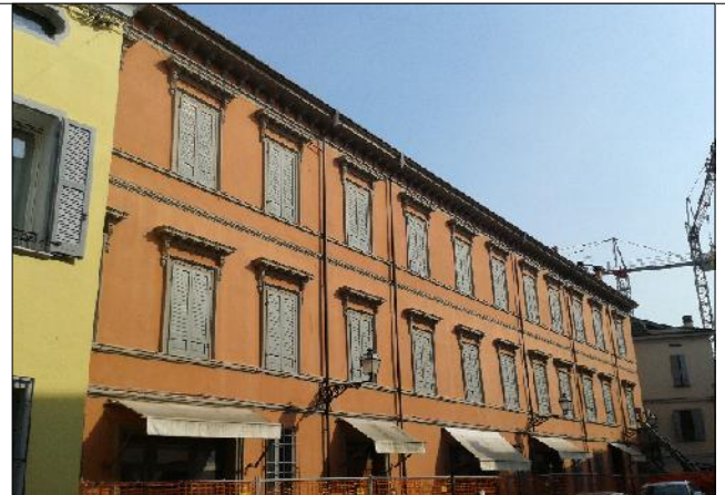
Prospetto su via della Pace n.70-72-74-76-78-80