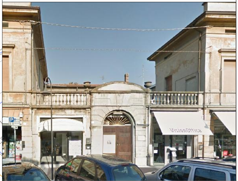
Prospetto su viale Garibaldi n. 9 - 11 - 13