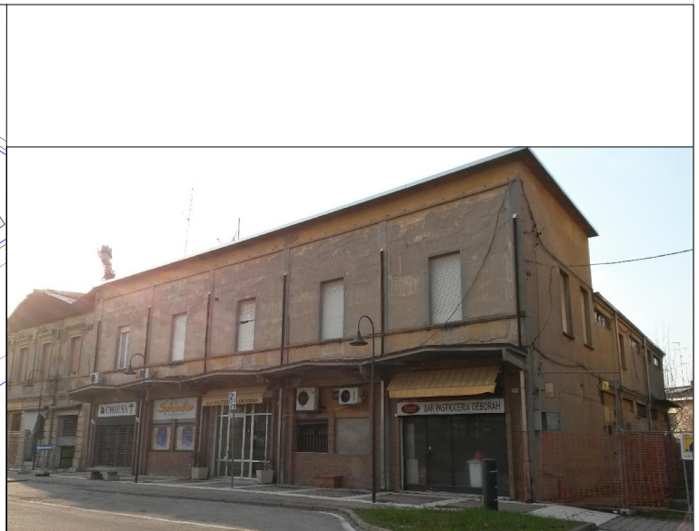
Prospetto su viale Garibaldi n. 25 - 27 - 29