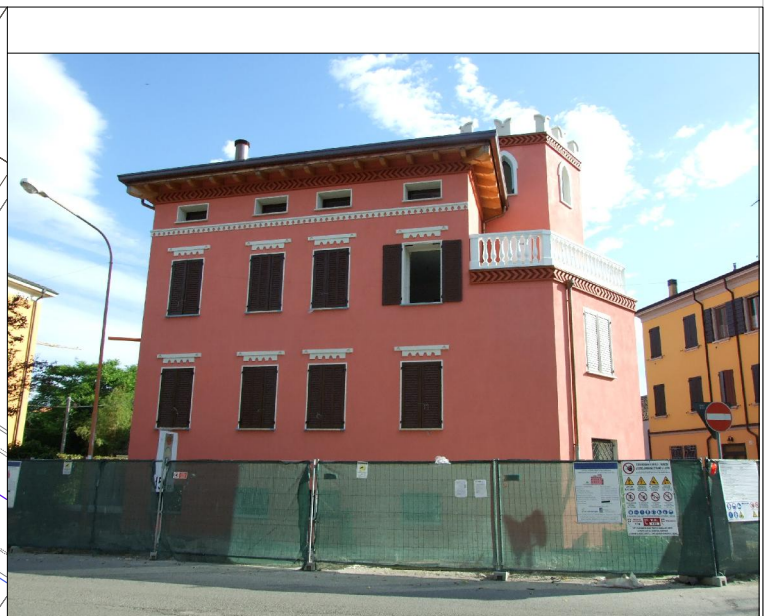
Prospetto su via Decime n. 8