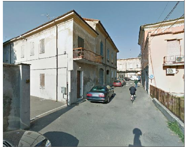
Prospetto su via Muratori n. 11 - 13