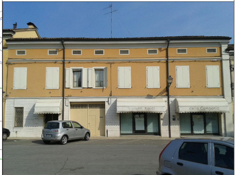
Prospetto su via della Pace n. 86 - 86A - 88 - 90