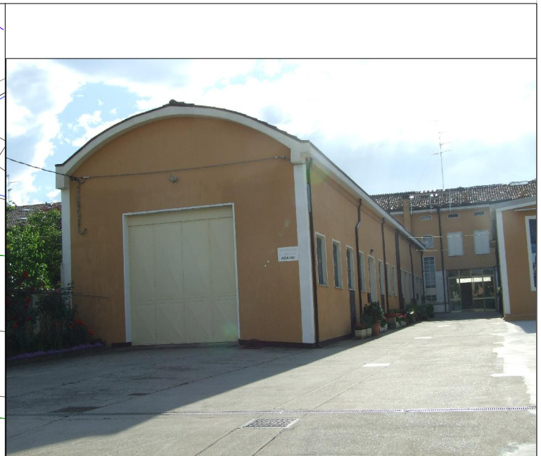
Prospetto su via Decime n. 9