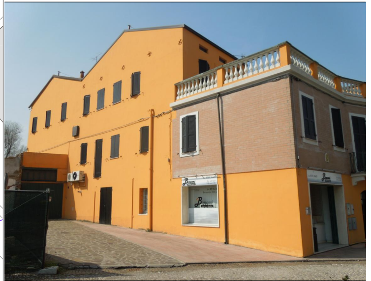
Prospetto su piazza della Repubblica n.