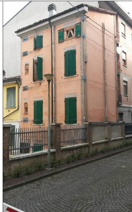
Prospetto su piazza della Repubblica