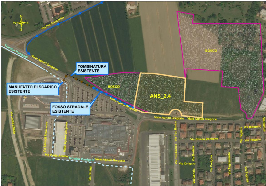
Immagine n. 1